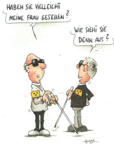
entnommen aus: Behinderte Cartoons 5, „Die Lizenz zum Parken“