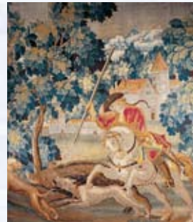
Wandteppich „Wildschweinjagd“ aus der Werkstatt de Chaux, 18. Jh. (Ausschnitt)