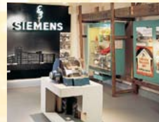
Siemens prägt das moderne Erlangen.