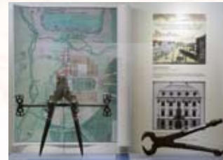
Schauvitrine zum Wieder- aufbau, mit Homann- Stadtplan, 1721, und Zimmermannszirkel, 18. Jh.