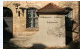
Alter Eingang in den Rathauskeller, Luftschutz-Befehlsstelle 1940/45