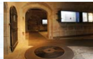
Blick in den Museums-keller mit Brunnen des Vorgängerbaus