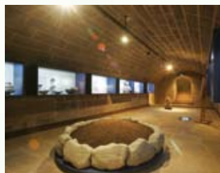
Ausstellungsraum Kult und Bestattung – zugleich Ort der Erinnerung an die kampflose Stadtübergabe am 16. April 1945

Zu den herausragenden Objekten zählen ein etwa 25 000 Jahre altes Steingerät aus einer Spardorfer Lehmgrube oder einer der gravierten Steinblöcke, die als „Erlanger Zeichensteine“ in die Literatur eingegangen sind. Auch der „Kosbacher Altar“ wird als einzigartige prähistorische Kultstätte gewürdigt.