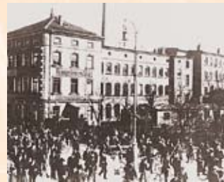
Die elektrotechnische Fabrik Reiniger, Gebbert und Schall, 1914 – Ursprung der Siemens-Medizintechnik