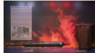
Schauvitrine zum Altstadtbrand am 14.8.1706

Ein wichtiges Zeugnis der Altstadt ist das angrenzende schiefwinklige Gewölbe, das auf einen Vorgängerbau des Altstädter Rathauses zurückgeht. Die hier gezeigten Pläne zu den umliegenden Kellern geben Hinweise auf die unregelmäßige Ausrichtung der Straßen und Gebäude vor dem Brand von 1706. Es wird deutlich, wie sehr der Wiederaufbau im Stil der barocken Neustadt den ursprünglichen Stadtgrundriss verändert hat.