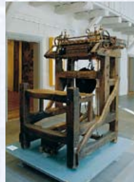
Strumpfwirkerstuhl, Erlangen, 1716 Die Strumpfwirkerei war das Hauptgewerbe der Erlanger Neustadt.