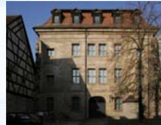
Blick vom Innenhof auf das Museumsgebäude

Eine Stärke des Museums sind anspruchsvolle Sonderschauen. Hierzu zählen Ausstellungen zur lokalen Erinnerungskultur, aber auch zur Kultur- und Zeitgeschichte, zur Medizingeschichte und Kunst. Gerade dieses Spektrum, das durch Kooperationspartner, wie die Universität, mit geprägt wird, findet beim Publikum große Resonanz.