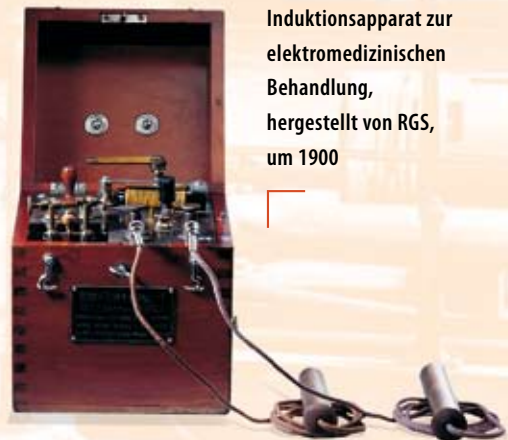
Induktionsapparat zur elektromedizinischen Behandlung, hergestellt von RGS, um 1900