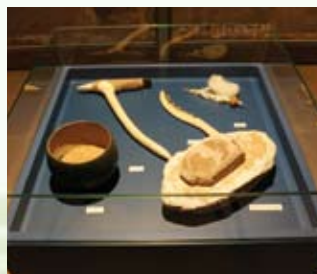
Schauvitrine mit originalen und rekonstruierten steinzeitlichen Arbeitsgeräten (Steinbeil, Erntemesser, Mahlstein und Läufer, Spindel, Tongefäß)