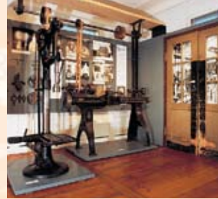
Maschinen aus der Betriebschlosserei der Firma Zucker, um 1900

Die technischen Errungenschaften und sozialen Probleme der Zeit werden am Beispiel der Elfenbeinkammfabrik Bücking, der Bürstenfabrik Kränzlein, der Lederwaren- und Kartonagenfabrik Zucker, aber auch der „Erba-Spinnerei“ und von „RGS“ anschaulich gemacht. Darüber hinaus geben Sonder-sammlungen, etwa Bleistiftspitzer von Möbius und Messgeräte von Gossen, Einblick in das Warensortiment Erlanger Firmen.