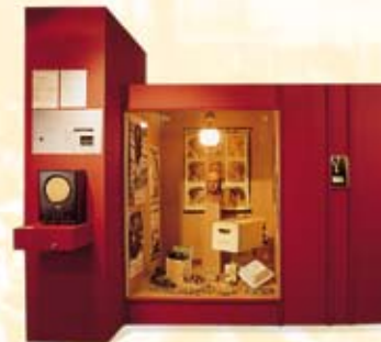
Erlanger Alltag im Nationalsozialismus